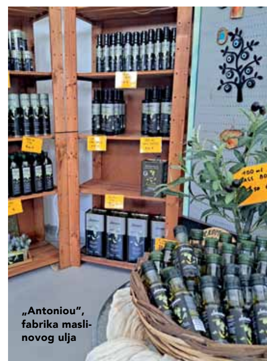
„Antoniou“, fabrika maslinovog ulja

Najpoznatiji lokalni specijaliteti su tradicionalna Skopelos pita s kozjim sirom u obliku spirale, organski med, šljive koje se dodaju raznim mesnim jelima ili slatkisima i od kojih se kuva džem ili se pak suše, zatim vino, sveže ulovljena riba i morski plodovi i, naravno, maslinke i maslinovo