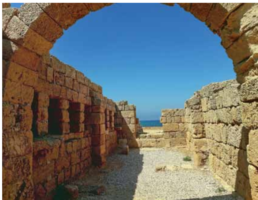
OSTACI GRADA CEZAREJA

AKRA ILI AKKO JE MALI MEDITERANSKI GRAD, SA BOGATOM ISTORIJOM I JEDAN JE OD NAJDUŽE NASELJENIH GRADOVA SVETA. NAJVEĆI PROCVAT JE DOŽIVEO U VREME KRSTAŠKE I OSMANLIJSKE VLASTI, KOJI SU DOSLOSVCE ZATRPALI PESKOM KRSTAŠKI GRAD I PREKO NJEGA SAGRADILI SVOJ. A MI SMO UŽIVALI U OBILASKU STARE I RENOVIRANE KRSTAŠKE CITADELE I KOMPLEKSU DVORANA ISPOD ULICA DANAŠNJE AKRE.