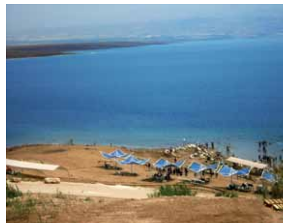
OBALA MRTVOG MORA

Masada je jedna od najvećih turističkih atrakcija Izraela u današnje vreme. Ostaci nekadašnje jevrejske tvrđave nalaze se na visokom kamenom platou, iznad Mrtvog mora, na istočnom obodu Judejske pustinje. Poznata je po bici između Jevreja i rimskih legionara. Kada su shvatili da neće moći da se odbrane, većina branilaca i stanovnika na tvrđavi su izvršili samoubistvo. Nismo uspeli da je posetimo, jer je tog dana kada smo prolazili pored nje bio petak i Šabat, neradni dan za Jevreje. Posetu Masadi ostavljamo za drugi put, jer istorija Izraela nastavlja da golica maštu i budi želju da se istražuje još više i da se korača njenim misterioznim putevima.